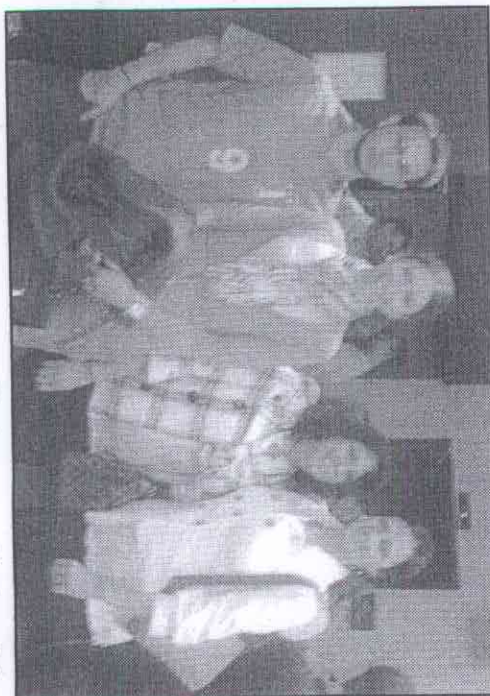
Film je, nakon prikazivanja u Los Angelesu i Chicagu napokon prikazan i u New Yorku i to u dva termina u filmskom centru Cantor na Manhattanu, a u organizaciji mlade Hrvatske američke udruge „The Croathians of New York & Los Angeles“.